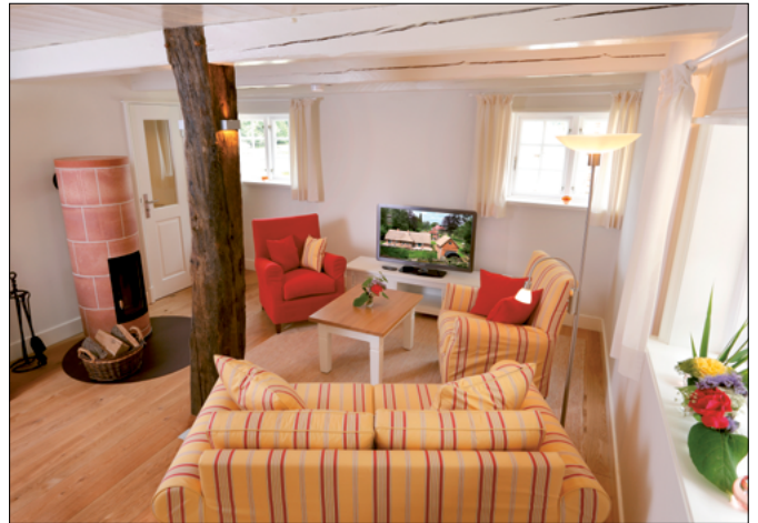
Wohnzimmer der Wohnung I