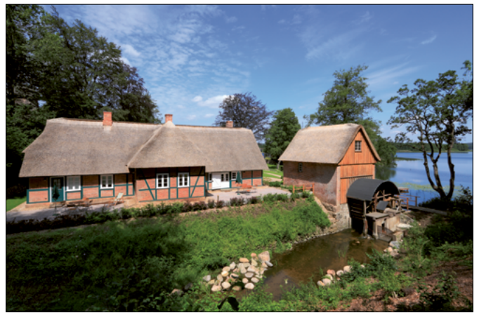
Terrassen des Fischerhauses an der Mühlenau

Für beide Objekte stehen W-Lan und Telefone kostenfrei zur Verfügung. Fahrräder, e-Bikes und Boote können angemietet werden. Bettwäsche und Handtücher sind im Preis enthalten.