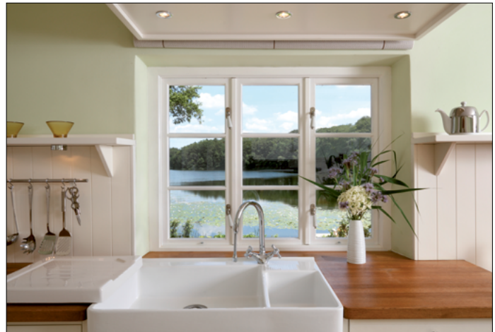
Blick aus der Landhaus-Küche