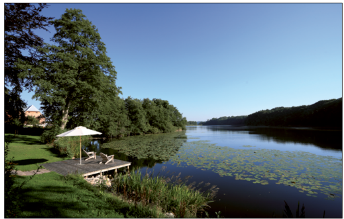
Seeplattform des Englischen Landhauses