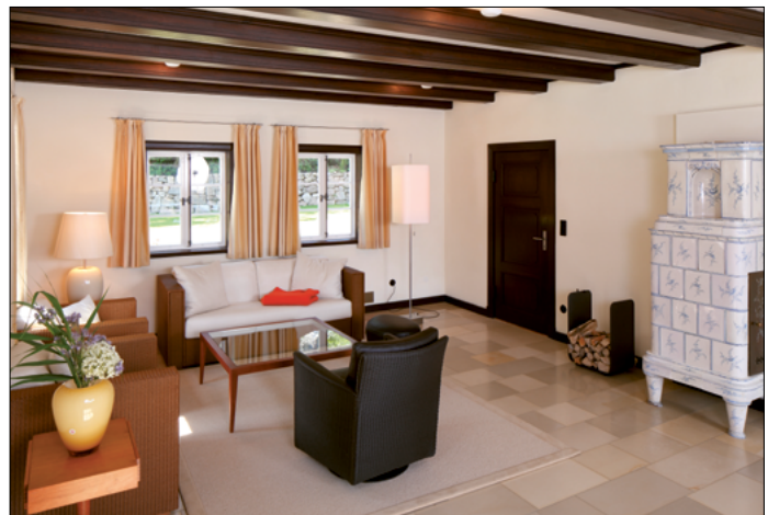
Wohn-Eßzimmer mit Kachelofen