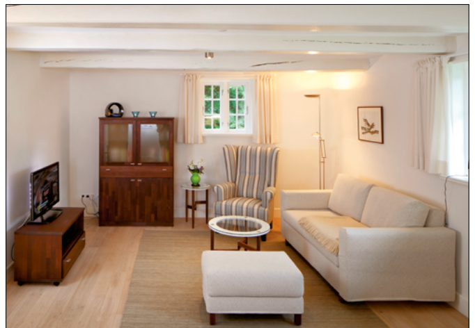
Wohnzimmer der Wohnung II